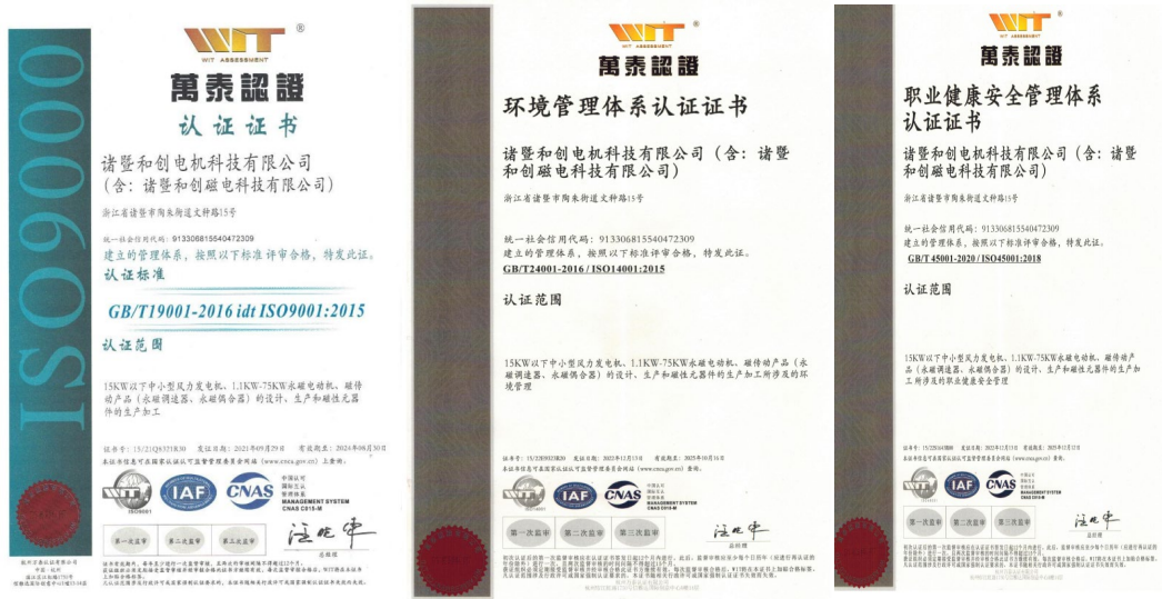
图表 4-1 公司证书扫描件